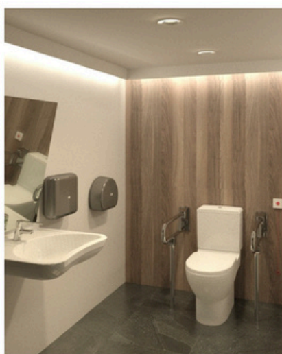
3 Aseo PMR - render 3 2.2